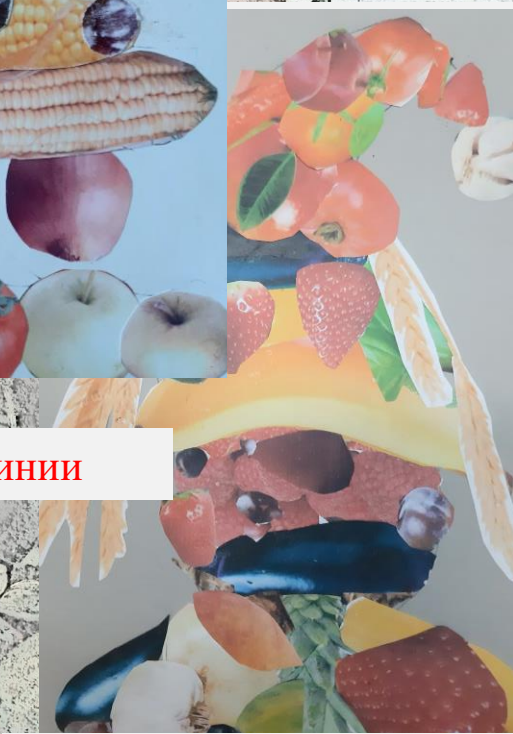
Дед Мороз в Витамины