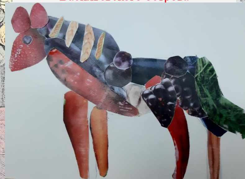
Лошадь из Витамины