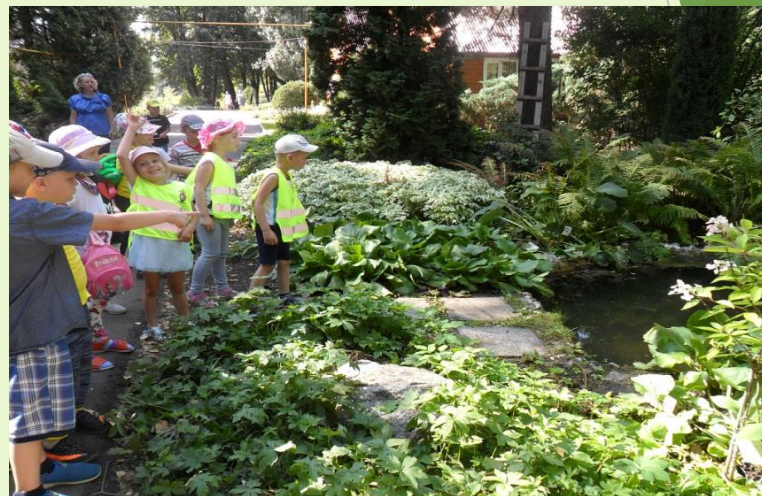
Наблюдения, экскурсии, беседы