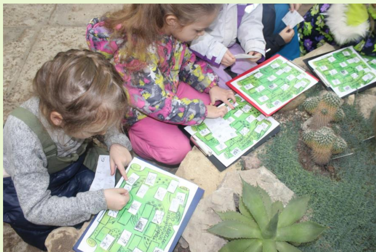
Проблемные ситуации, ребусы, кроссворды, логические задачи