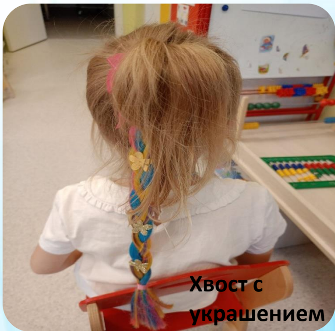
Хвост с украшением