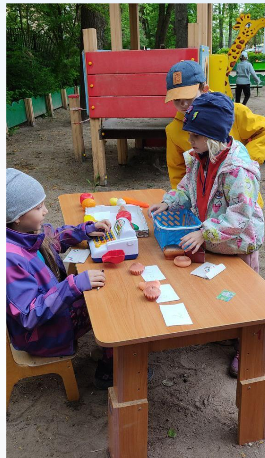
профессия - продавец