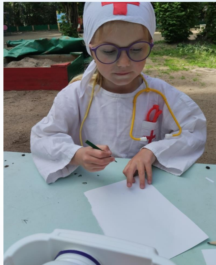
профессия - врач