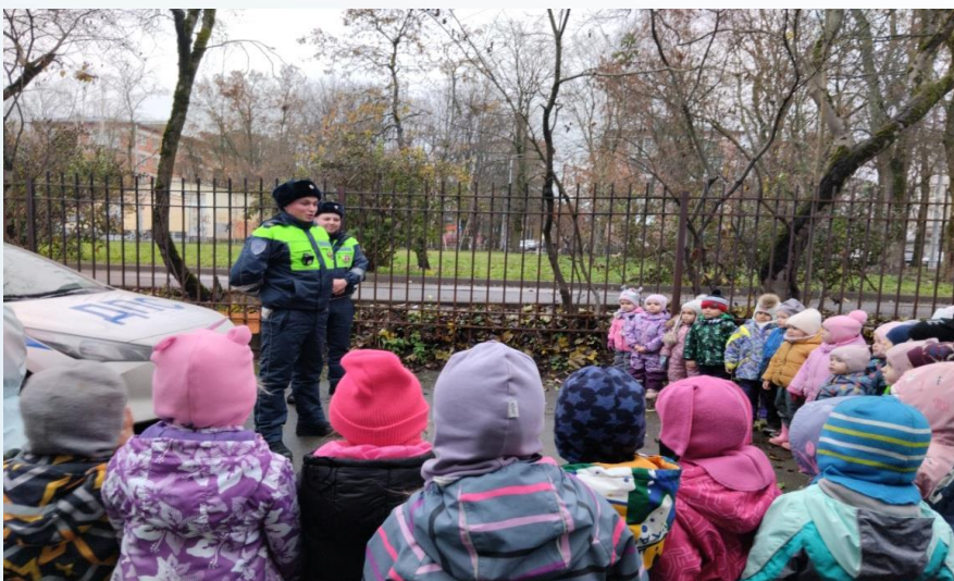
профессия - полицейский