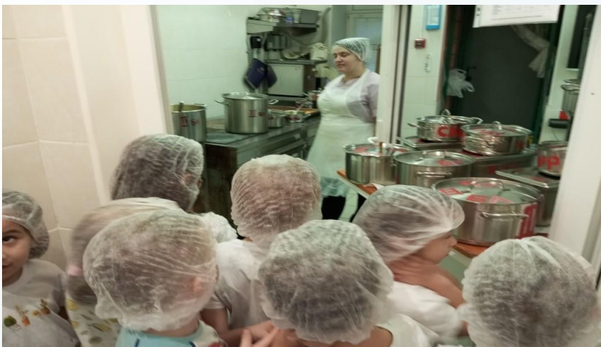
профессия - повар