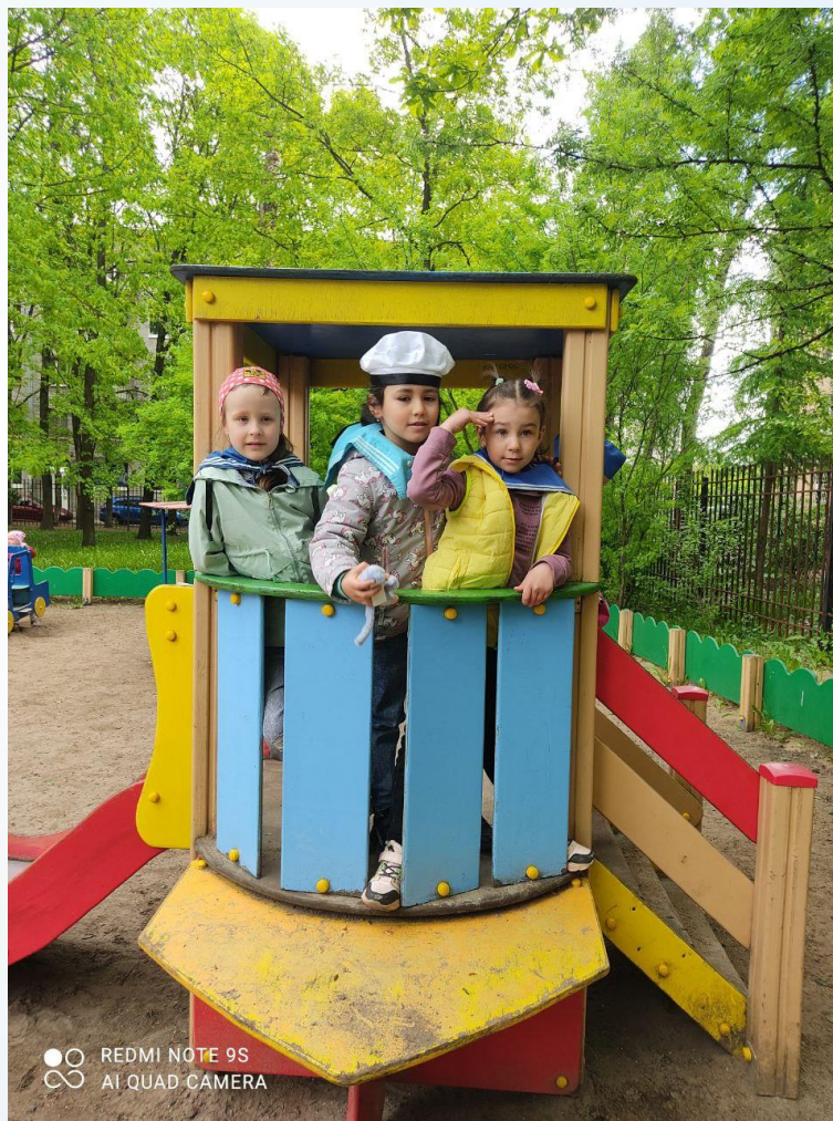
профессия – моряк