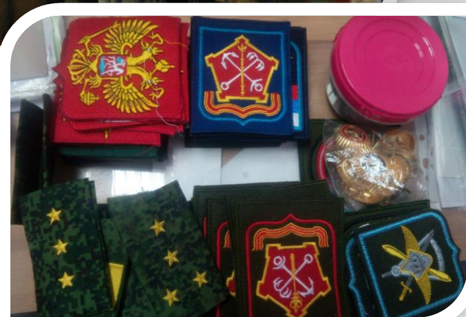
Коллекция военной атрибутики