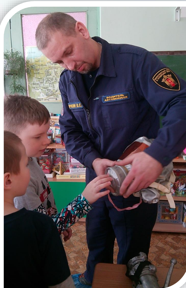
Экскурсия в пожарную часть